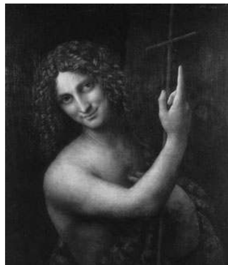
Leonardo da Vinci: San Giovanni Battista 1513-1516 circa olio su tavola; 69 x 57 Parigi, Louvre